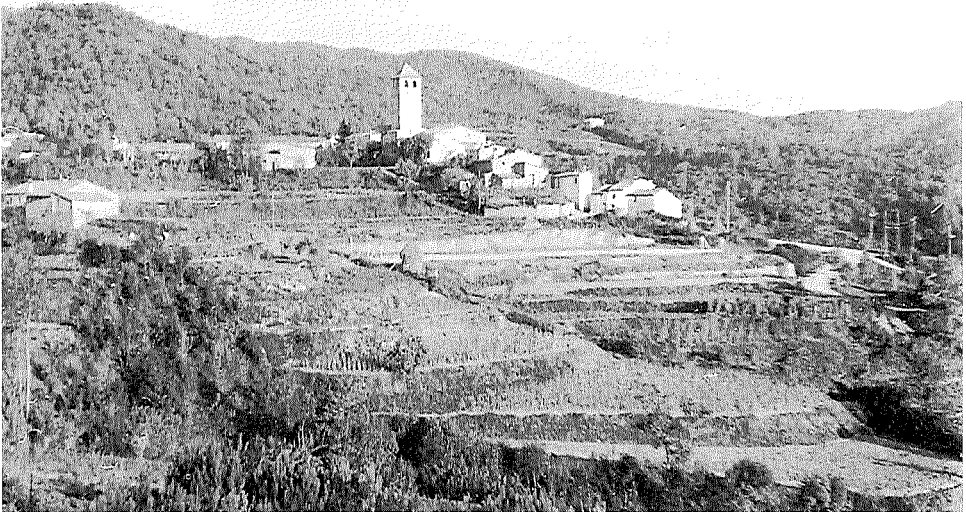
Espinelves, una trentena d'anys enrere.

Ja que diem que el costat esquerre de la riera pertany al Montseny, començarem per un dels punts més alts, el turó de la Creu de Matagalls (1.697 m), d'on baixa a coll Pregon (1.530 m), puja al turó Sesportadores (1.608 m) i passa pel carener de coll de Joan i turó dels Llancers, baixa al coll de Bordoriol (1.069 m) i s'enfila al turó de la Tremuleda (1.160 m), que té al costat el Puigsasuc (1.069 m). Precisament en els vessants d'aquests dos turons és on té el naixement la riera d'Espinelves. Per la banda esquerra de la riera trobarem el carener de Coll-sespre-gàries, que baixa a trobar el coll de Gomara, per on passa la carretera; sobtadament s'enfila fins a trobar el turó de la Roca de la Consolva (994 m), el vessant nord del qual conflueix tot a la riera d'Espinelves, ja dintre del seu terme municipal. De la Consolva salta a Pla Ventosa (844 m), molt a prop de Can Feliu, puja carena amunt fins a trobar "La Petxa de Sant Martí", continua llarga la serralada, salta al collet de Pla Castellà (829 m) i s'enfila al turó de Pla Castellà (871 m), per encimbellar-se al turó de les Lloberes (924 m), el segon més alt del terme d'Espinelves, de la banda esquerra de la riera, en la qual desgassa pel vessant