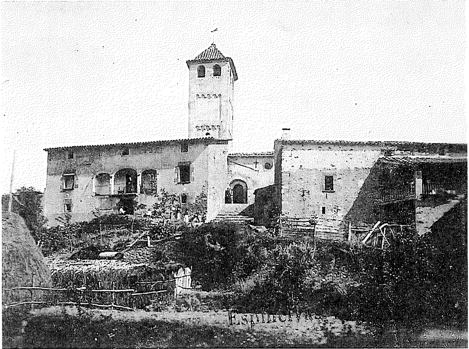
Aspecte de l'edifici de la parròquia d'Espinelves d'uns cent anys enrere.

ment. Segons els censos municipals, la població d'Espinelves era de 462 h. l'any 1877, 470 h. el 1887, 447 h. el 1897, 421 h. el 1900, 481 h. al 1930, 436 al 1960, i 170 habitants l'any actual (1998), dominant les persones de més de 30 anys, i quedant en minoria els que habiten les masies. El poble ha millorat d'aspecte, en conjunt, en el curs dels últims 30 anys, en què els particulars han fet noves edificacions o restauracions a les cases, i ha millorat també molt per la col·laboració de la Diputació de Girona, en obres d'interès de tot el poble, i des de fa uns anys de la Generalitat de Catalunya, cosa d'agrair per tots els que habitem aquesta vall d'Espinelves.