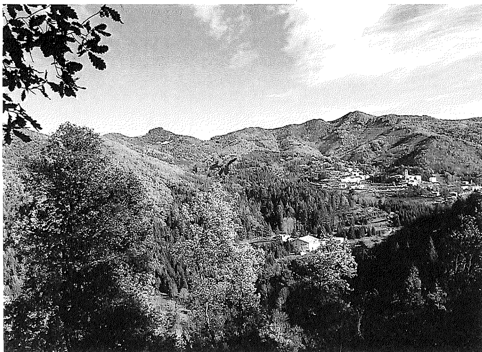
La vall d'Espinelves i la Fira de l'Avet de fa uns anys.

ganitzaren diversos concursos de fotografia, d'àmbit comarcal, després de tot Catalunya, i acabà en un concurs en què podien prendre part totes les províncies d'Espanya. Tingué molt d'èxit i cada any la cosa va anar a més, perquè, a més, s'assignaven uns bons premis per als guanyadors. Quan vingué la Fira de l'Avet d'Espinelves, les activitats es multiplicaren, de manera que van decidir deixa aquests concursos tan exitosos de fotografia en suspens.