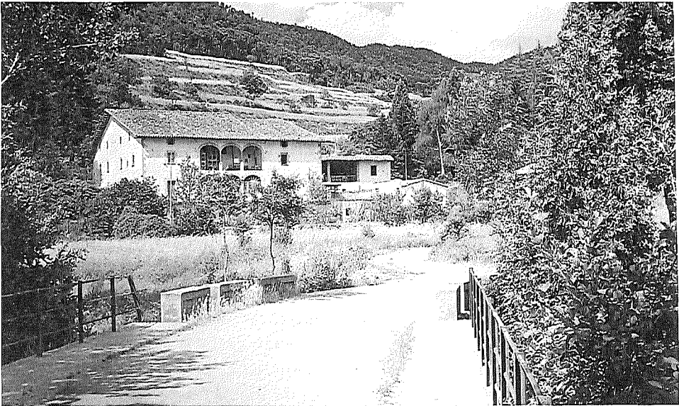
L'actual pont de la riera i les terres de cultiu agrícola d'aquell temps.

Aquest temporal de pluges va ser el més catastròfic que es recordava i de què es tingui coneixement en la història d'aquest poble, ja que es va emportar diverses rescloses de presa d'aigües i va afectar greument el pont del camí particular de davant de la casa de Masjoan, emportant-se'n la coronació de fusta, sobre la qual passaven els carruatges.