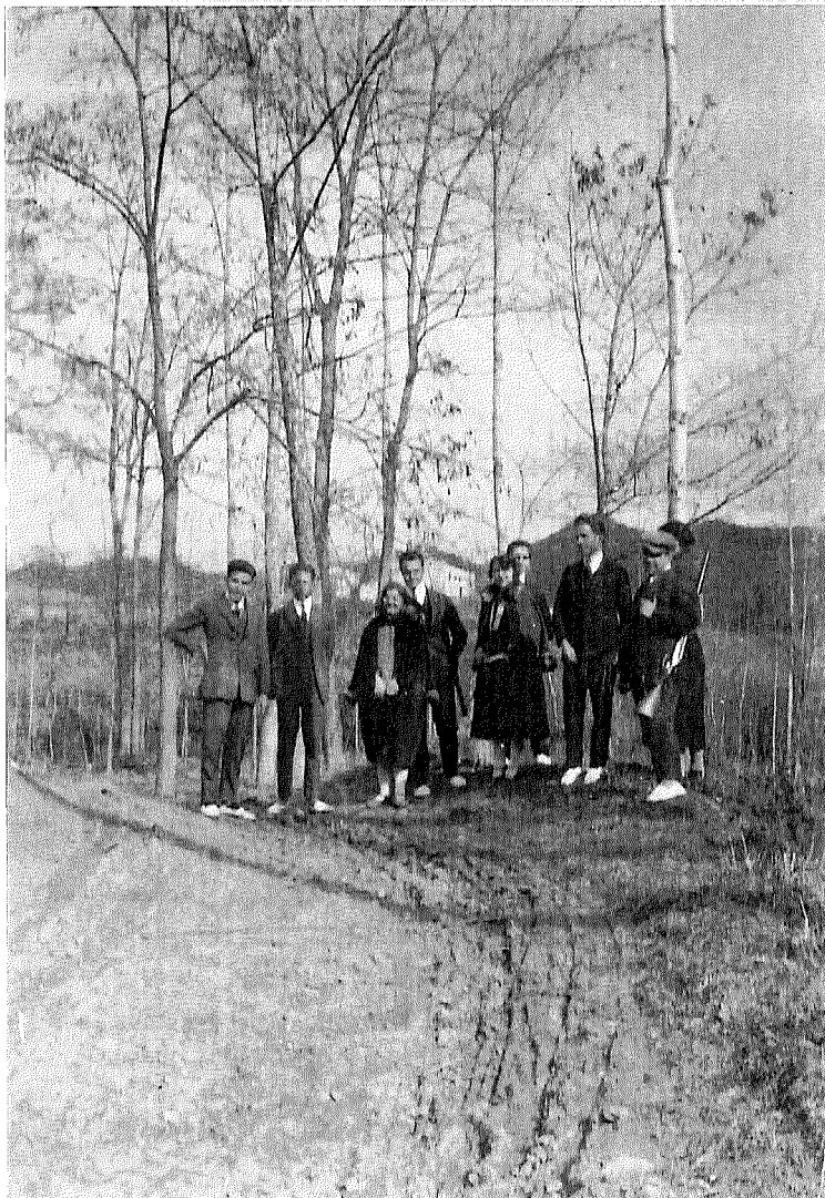
Camí rodat de coll del Buc l'any 1916. Al fons, el campanar d'Espinelvès i la rectoria, acabats d'emblanquinar.

El 23 de maig de 1894 ja estava la construcció en marxa; consta haver pagat a l'empresari Villermino Sieiro, a compte de jornals, 1.000 ptes.