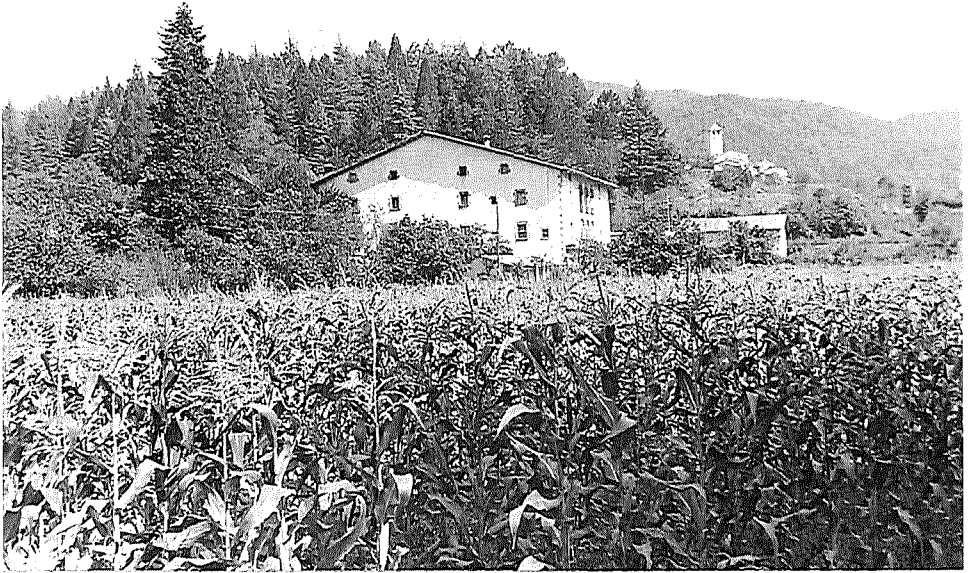
Espinelves a finals dels anys 40.

pera que por el Coll de Ravell pasará el Eje Transversal de Cataluña, ya que el estudio técnico realizado por el Ministerio de Obras Públicas así lo ha dictaminado, para seguir luego por San Hilario, Santa Coloma de Farnés, con una radial a Olot, y luego acabar en Gerona. No cabe decir que, cuando este proyecto del Eje se convierta en realidad, para la historia socioeconómica de estas comarcas empezará una nueva era, y más con el carácter tenaz y emprendedor de sus habitantes. Gerona quedará a media hora de San Hilario. Esta zona antes tan lejana, quedará al alcance de toda la provincia de Gerona.”