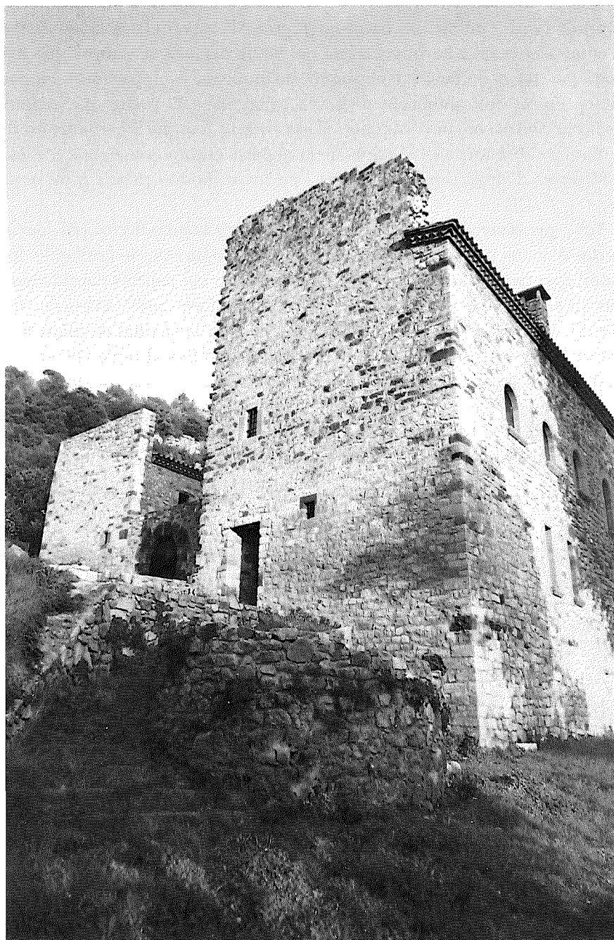
Murs de la façana nord i porta d'accés al pati