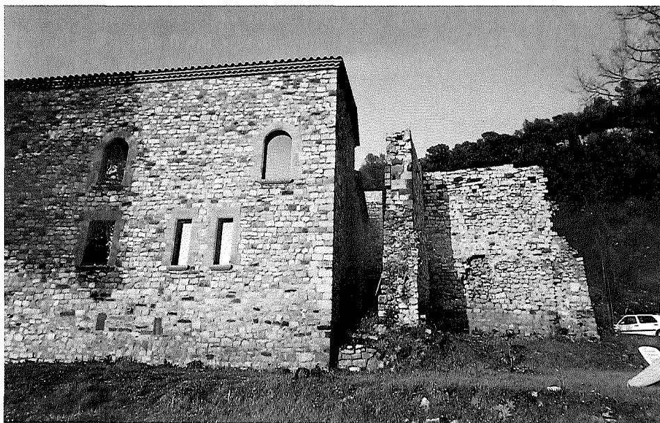
Restes de la torre i part de la façana oest reconstruïda.

Tot i que el senyor d'Aiguafreda devia exercir la jurisdicció civil com a mínim des d'abans del 1200, no va poder adquirir la jurisdicció criminal sobre la quadra, que permetia jutjar les causes criminals o els delictes considerats més greus (homicidis, segrestos, incendis provocats, furts amb violència), fins al segle XVI. Tenir la jurisdicció criminal volia dir tenir la facultat d'aplicar la pena de mort. El rei va ser el titular d'aquesta jurisdicció fins al segle XIV, en què va passar als vescomtes de Cabrera, gràcies a la creació a mitjan segle del comtat d'Osona, un nou senyoriu que res no tenia a veure amb l'antic comtat carolingi. El 1356 el rei Pere III va decidir recompensar els serveis i la fidelitat del seu privat Bernat II de Cabrera, vescomte de Cabrera, i el va nomenar comte d'O-