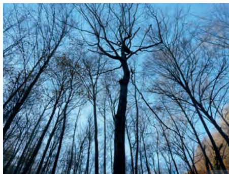
La fageda d’El Boixaus. (Foto J. Guillamon, novembre 2020).