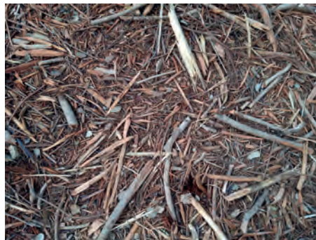
El parquet torturat després del pas de la desbrossadora. (Foto J. Guillamon, abril 2021).

A l'altre text, "Les azalees", la idea de la natura martiritzada ocupa el lloc central. Recorda el moment que vam començar a anar can Torrent, als anys noranta. A les feixes al voltant del mas hi havia les azalees que havien criat per vendre al casalot amb jardí que tenien al poble, al costat del nostre hostal. La meva mare n'havia tingut tres o quatre d'aquestes azalees que, com l'herba melsera del text de Les falgueres , s'havia endut a la casa de Barcelona. Perquè no es morissin, les regava amb aigua de pluja i sempre teníem cubells escampats per l'eixida, per recollir-ne. En el text que vaig escriure, la mare era a l'Hospital del Sagrat Cor ingressada: