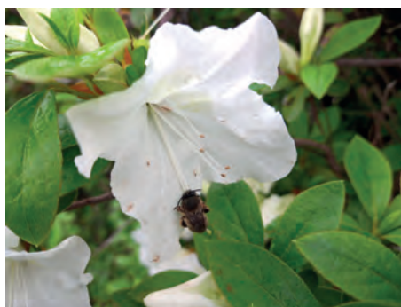
Can Torrent: azalea i romeguera, azalea i abella.