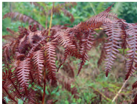
La falguera Aquilina com una àguila bicèfala. La falguera seca.