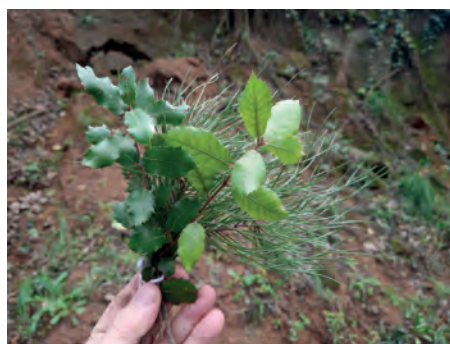
Esperrallac i herba de Sant Joan. Un ram per a la Lourdes. (Foto J. Guillaumon, novembre 2020 – novembre 2021).