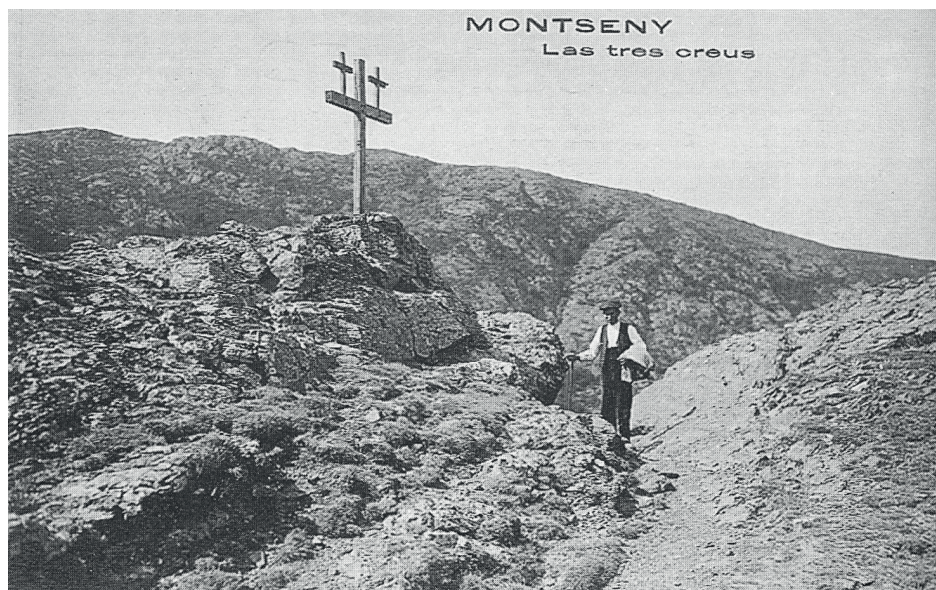
Les Tres Creus (Foto d'una postal s/d).

Les tres creus de la postal ja no existeixen en l'actualitat.