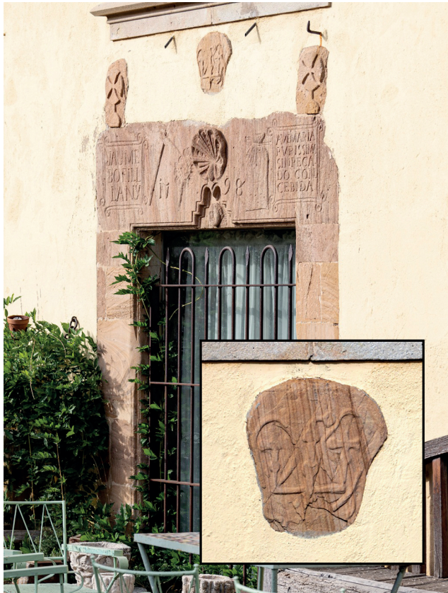
Llinda de Ca l'Herbolari.