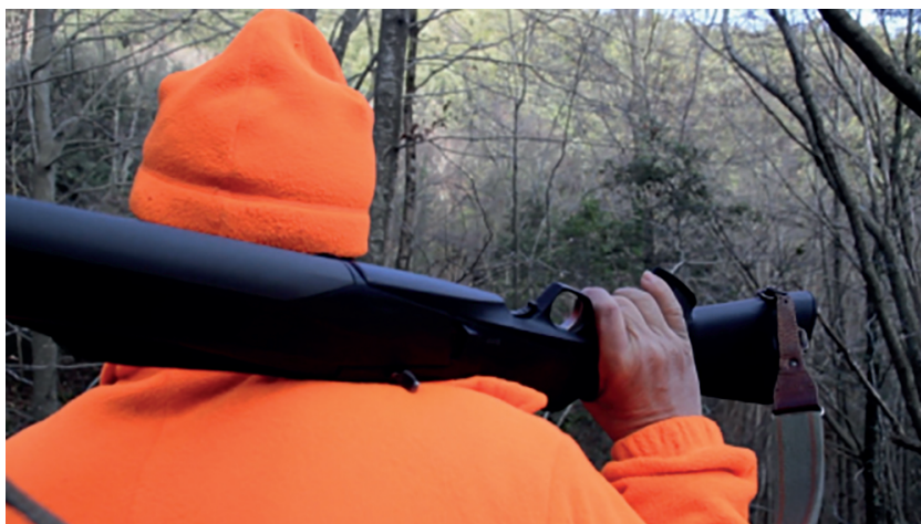
Colla Senglaners d'Arbúcies en plena batuda

moure'ns àgilment, com si fóssim cabirols, sempre pendents de les hores de llum, improvisant, adaptant-nos al terreny. I de banda sonora, L'île re-sonante d'Éliane Radigue, que ens va acompanyar fins a acabar la pel·lícula.