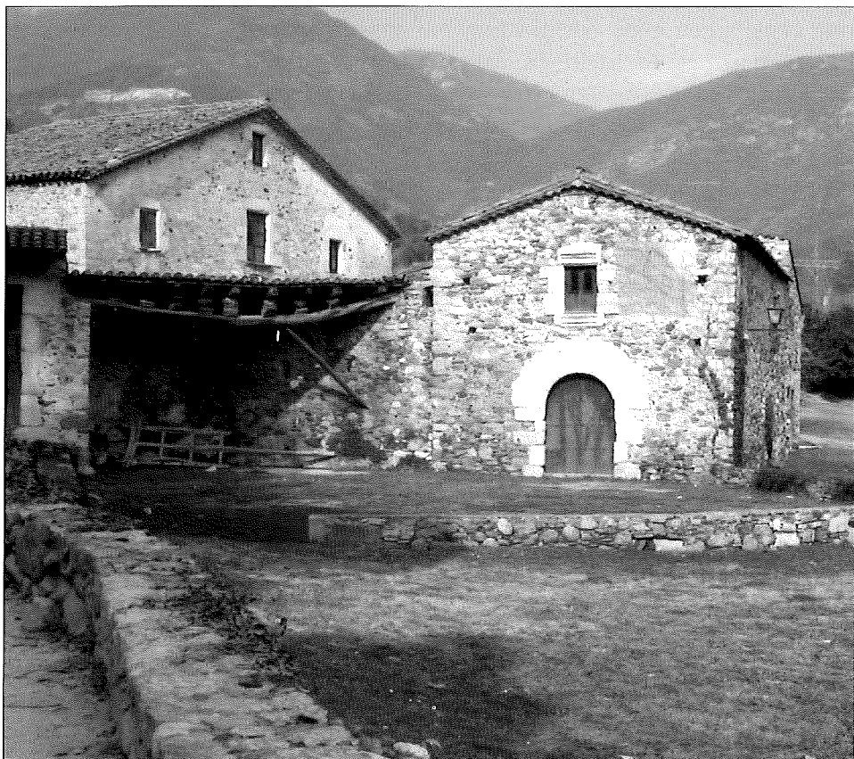
Can Figueres, també a Gualba