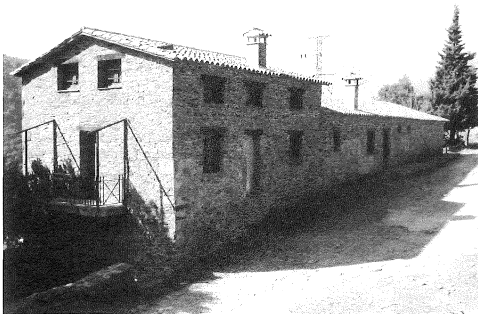
Masia de Font de Faig, casa de colònies.