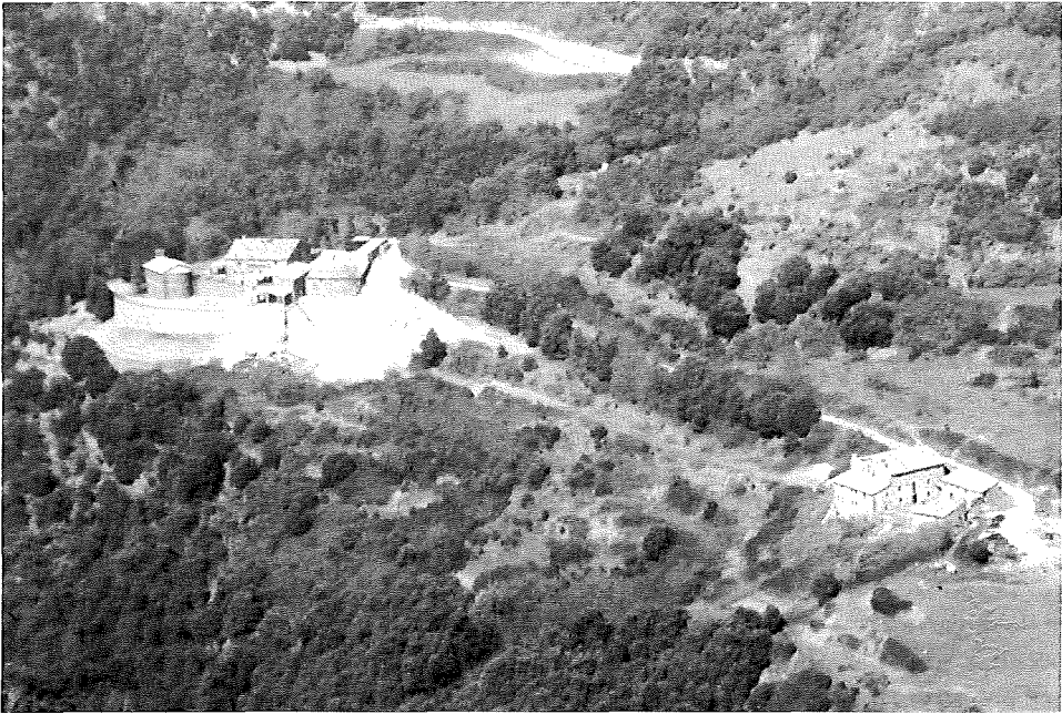
Vista de conjunt dels masos la Morera, en primer terme, i la Castanyera al fons.

Castanyera, que varen edificar en el dit lloc una masoveria dita la Casa Nova de la Castanyera o Font de Faig, nom aquest que és el que ha prevalgut pel fet de trobar-se el mas prop d'aquella abundosa font.